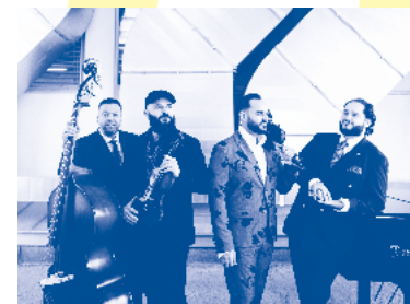
Janoska-Ensemble: Revolution! – Altbekanntes in neuem Licht