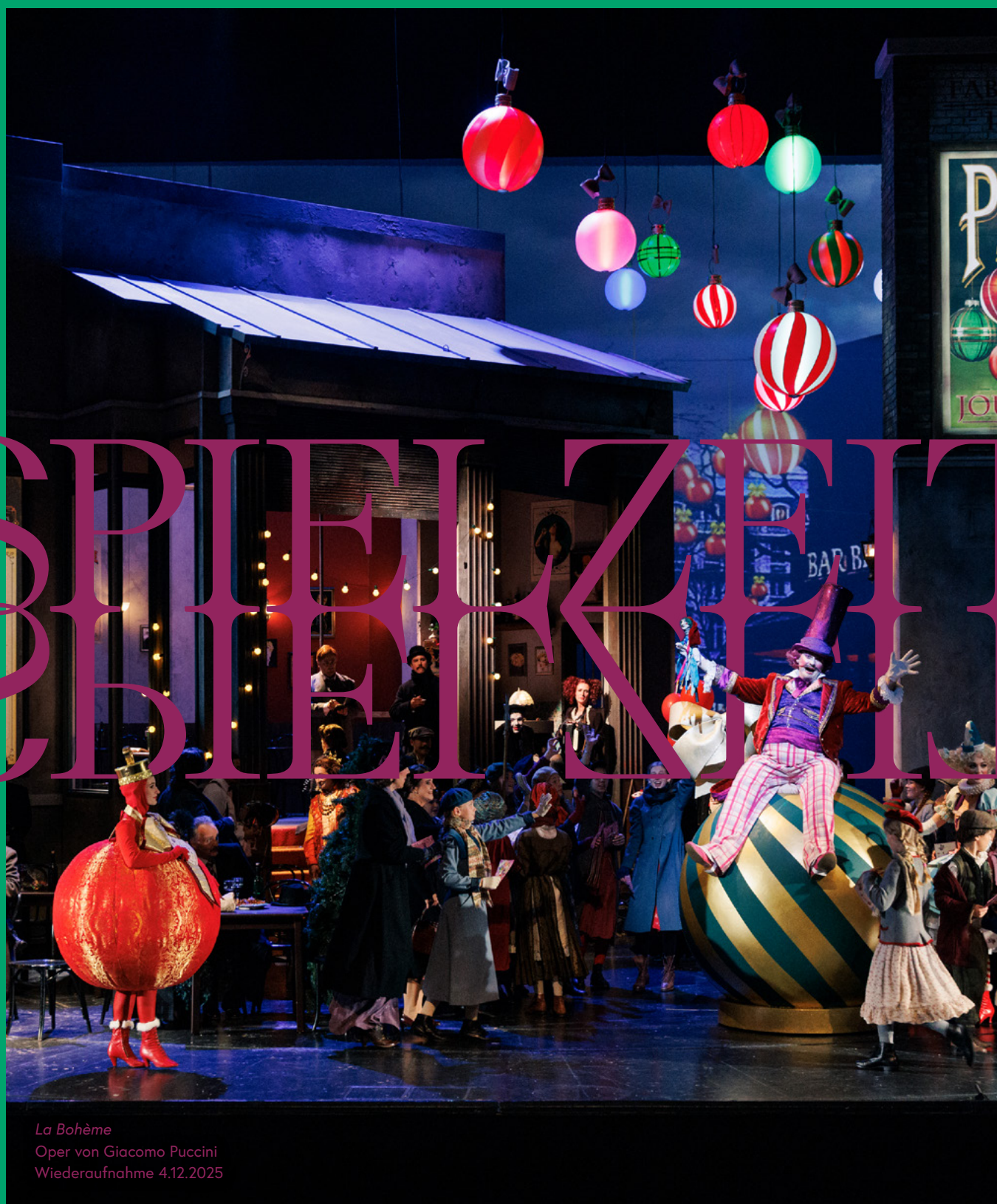
La Bohème Oper von Giacomo Puccini Wiederaufnahme 4.12.2025

Theaterzeitung des Badischen Staatstheaters Karlsruhe Spielzeit 2025 — 26