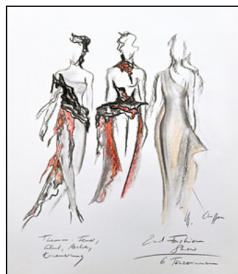
Kostümfigurinen von Verena Hemmerlein für die Szene „2. Fashion Show“

Seit seiner Popularisierung in den westlichen Medien, insbesondere ab dem 19. Jahrhundert, spielt der „Vampirkult“ eine wichtige Rolle in Kunst und Unterhaltung. Maßgeblich dafür verantwortlich ist der zum Welterfolg avancierte Roman Dracula des irischen Schriftstellers Bram Stoker. 1897 veröffentlicht, wurde das Buch zu einem Bestseller und ist bis heute ununterbrochen im Druck. In der Erzählung erscheint der Vampir als finsterner, ausländischer Aristokrat, der sich mit einer gewissen Eleganz und Geschicklichkeit in der feinen Gesellschaft bewegt. Diese Darstellung wurde zum Urbild des männlichen Vampirs – einer hypnotisch anziehenden Kreatur, getrieben von teuflischem Stolz und geheimer Melancholie. Hunderte internationaler Theaterproduktionen – darunter Opern und Ballette – brachten seither diese Kreaturen der Nacht auf die Bühne: eine Mischung aus bösen Schurken und romantischen Antihelden.