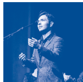
Atalanta – Der Traum von einer heilen friedlichen Welt

Im Zentrum der Karlsruher Händel-Festspiele 2026 steht die 1724 uraufgeführte Oper Tamerlano , die aus Händels Opernschaffen auf besondere Weise herausragt: Sie ist ein ungewöhnlich psychologisch angelegtes Musikdrama von ebenso zwischenmenschlicher wie politischer Dimension. Wenngleich die Handlung lose historische Begebenheiten aufgreift, ist sie problemlos auf andere Zeiten übertragbar. So steht eine Aussage des vom Mongolenfürsten Tamerlan gefangenen Sultan Bajazet als Motto über den Festspielen: „Standhaftigkeit und Verachtung sind Waffen gegen die Tyrannei.“ Dieses Thema bietet einerseits die Gelegenheit, ein jederzeit und überall präsent Herrschaftsphänomen mit den Mitteln der Kunst zu betrachten. Und andererseits lässt es sich auch im Sinne des Aufbrechens von starren Reglementierungen verstehen. Viele der Programmpunkte des Konzert- und Rahmenprogramms schöpfen daraus ihre Inspiration. Beispielhaft seien hier vier davon herausgegriffen, die die inhaltliche Bandbreite von der pastoralen Idylle der Oper Atalanta bis zum Ausbruch einer musikalischen Revolution durch das Janoska-Ensemble abstecken.