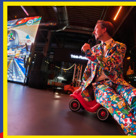
Let's Play 4.2. & 5.5.26