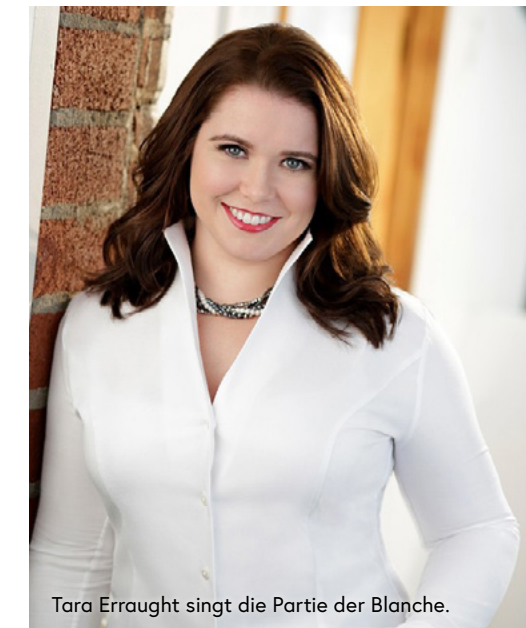
Tara Erraught singt die Partie der Blanche.

In beiden Opern steht eine junge Frau im Spannungsfeld zwischen Religion und Realität und geht selbstaufopfernd in den Tod. Diese Entwicklung wird allerdings von zwei extremen Seiten aufgerollt: Während die junge Adelige Blanche de la Force in Zeiten der Französischen Revolution ins Kloster flieht und im Getriebe der Schreckensherrschaft zu innerer Stärke findet, wählt rund 200 Jahre später an der öden Küste Schottlands die frischverheiratete Bess das Martyrium sexueller Aufopferung – in dem Glauben, dadurch Gottes Willen zu folgen und ihren schwerkranken geliebten Ehemann Jan heilen zu können.